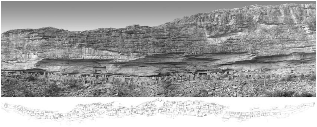
Photo 2: L'ancien village de Teli niché dans la Falaise de Bandiagara. Le dessin montre l'emplacement des constructions anciennes.

Old village of Teli in the Bandiagara Cliffs. The drawing shows the location of traditional buildings.